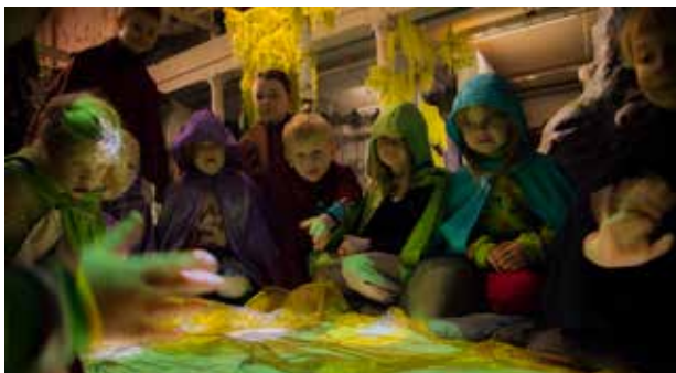
Lapsiryhmä Metsänpeitto -näyttelyssä.

Katso tarkemmat kuvaukset toiminnallisista näyttelykierroksista ja niihin liittyvistä ennakottehtävistä sekä työpajavinkkejä tehtäväksi kierroksen jälkeen Villa Artun verkkosivuilta, www.villaarttu.fi .